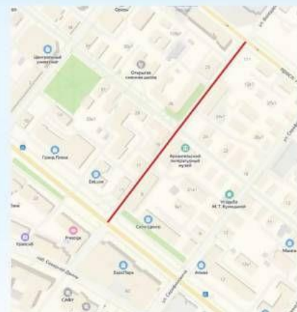
ул. Володарского от пр. Троицкий до пр. Ломоносова