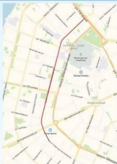
просп. Советских Космонавтов от ул. Поморская до ул. Гагарина