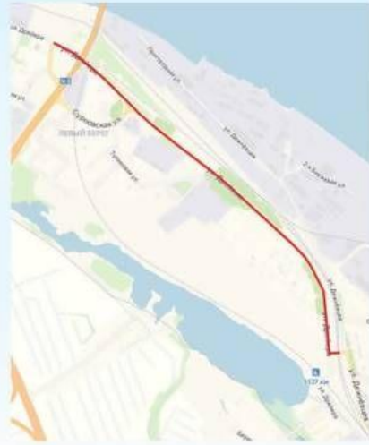
ул. Дрейера от дома №6 по ул. Дрейера до ул. Дежневцев