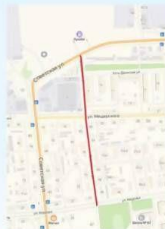
ул. Ярославская от ул. Кедрова до ул. Советская