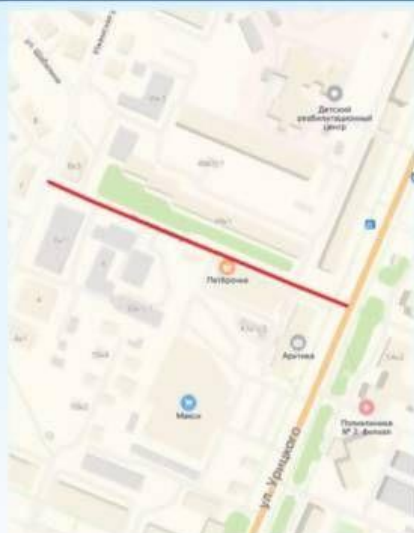
ул. Учительская от ул. Шабалина до ул. Урицкого