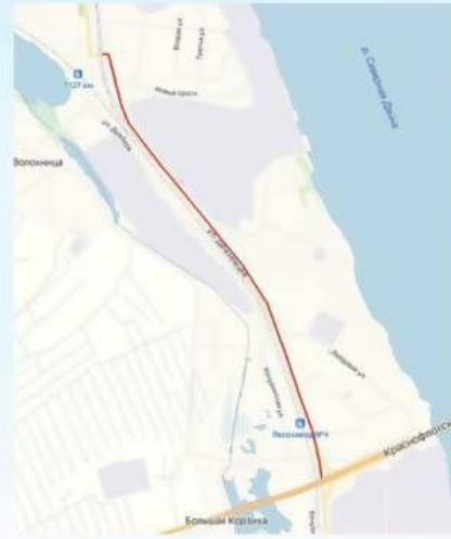
ул. Дежневцев от ул. Дрейера до ул. Нахимова