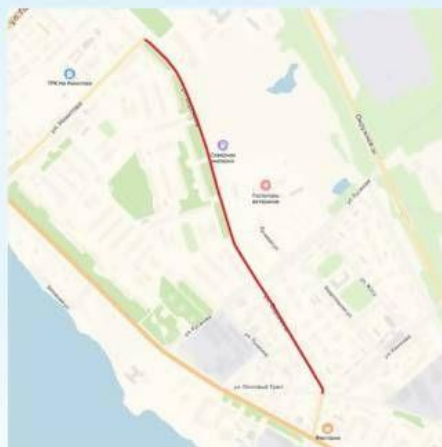
ул. Воронина от ул. Никитова до ул. Революции