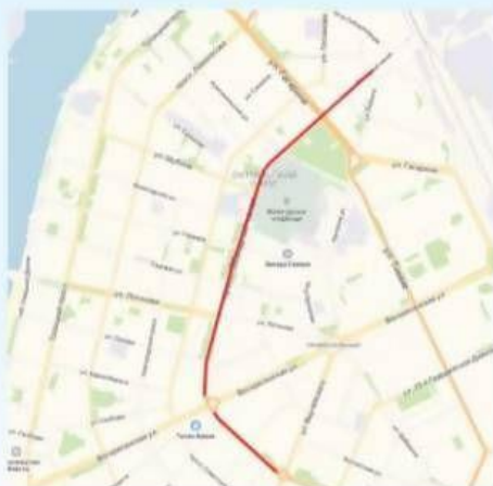
пр. Обводный канал от ул. Тыко Вылки до ул. Выучейского